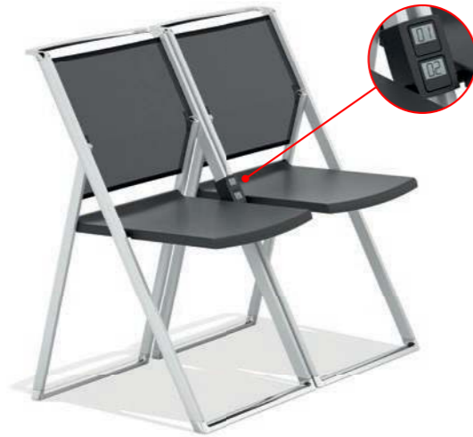
Zifra Battery-free numbering