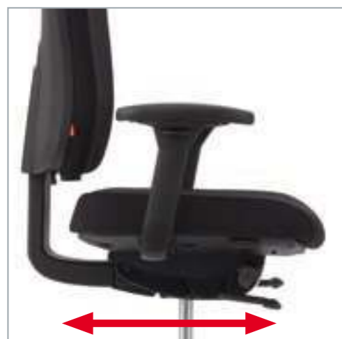
Schiebesitz zur Verkürzung und Verlängerung der Sitztiefe. Schuifzitting ter verlenging of korter maken van de zit diepte.