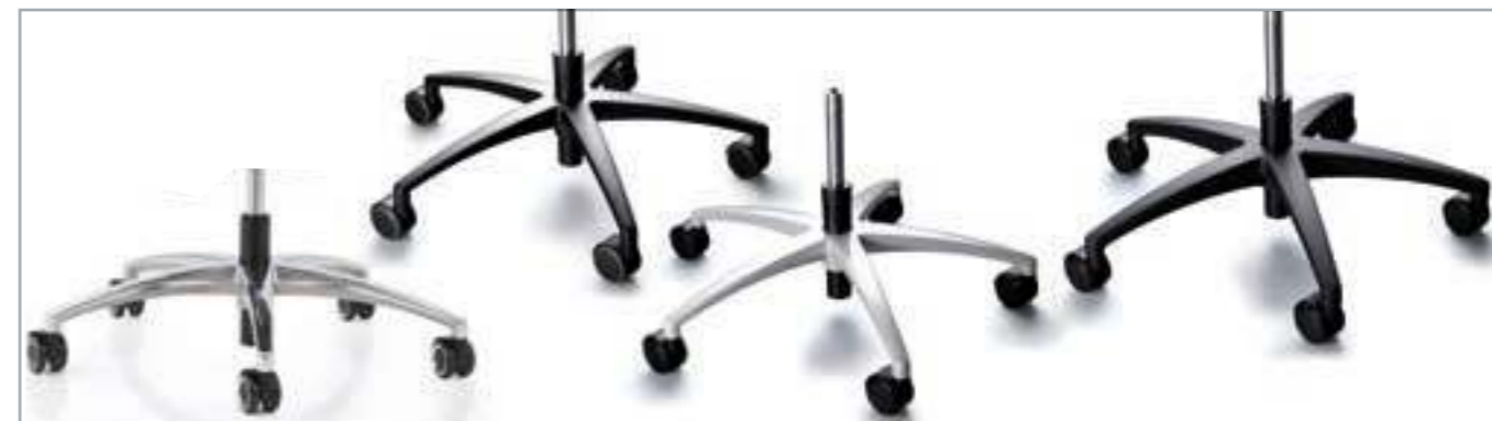
Fußkreuze wahlweise in Alu poliert, Alu Schwarz, Alu Weiß oder glasfaserverstärktem Polyamid. Universalrolle mit Chromapplikation oder Standardrollen hart oder weich mit Abdeckung.