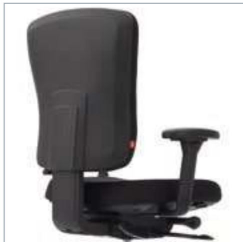
Robuste Polyamid-Außenschale, werkzeugfrei abnehmbar. Sterke Polyamide-Buitenschaal, zonder gereedschap afneembaar.