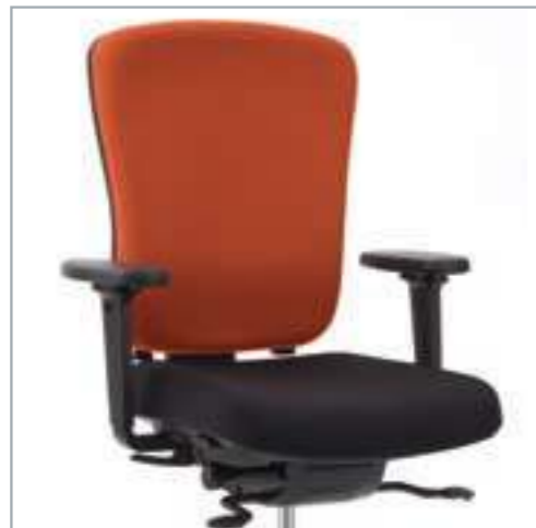
53 cm hohe Rückenlehne mit KÖHL-Bandscheiben-Stütze (KBS®). 53 cm hoge rugleuning met KÖHL-Lendensteun (KBS®).