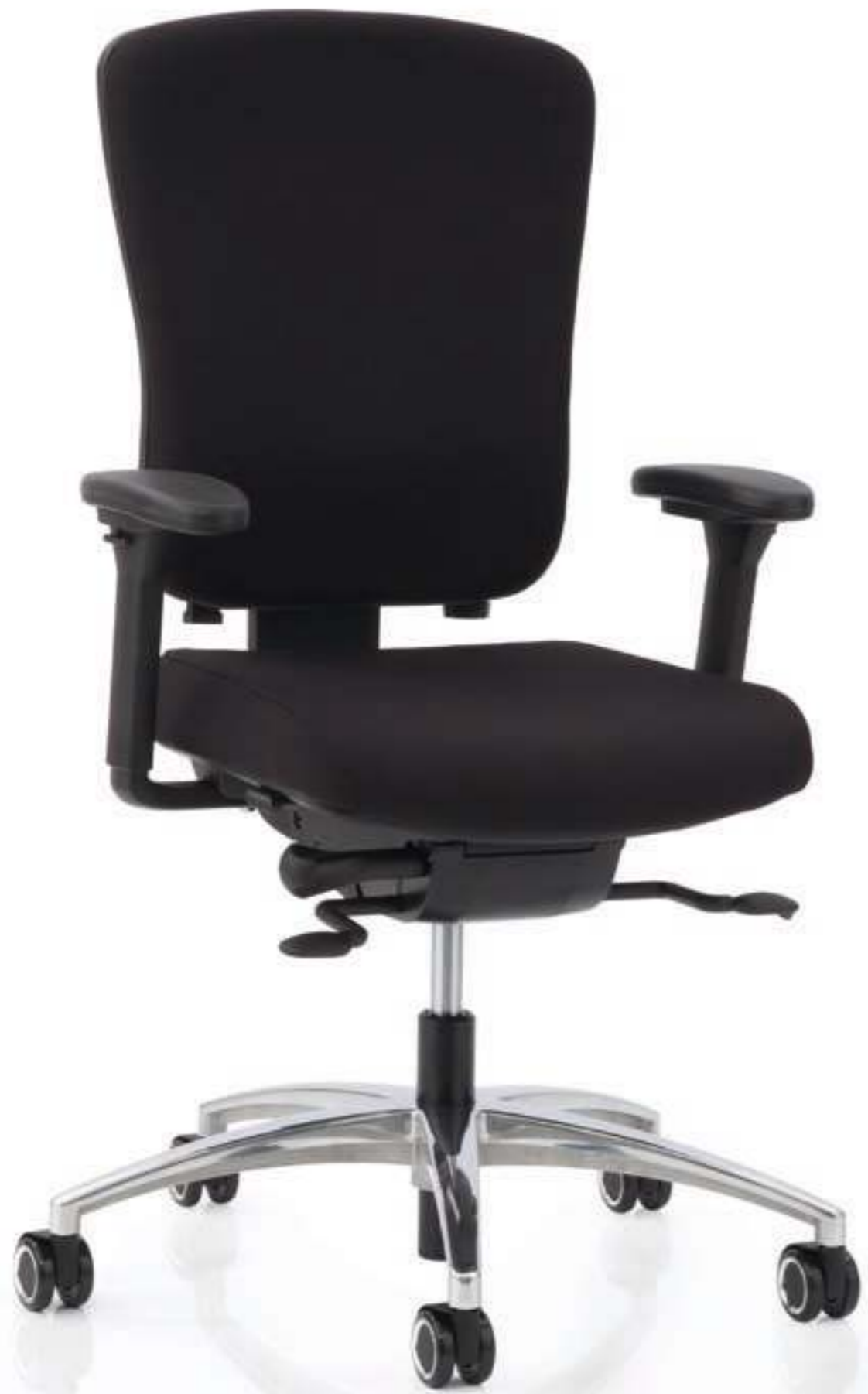
MULTIPLO® Drehstuhl, CONSITO® Schwinger mit Matrix Rückenlehne. MULTIPLO® bureaustoel. CONSITO® sledeframe met Matrix rugleuning.