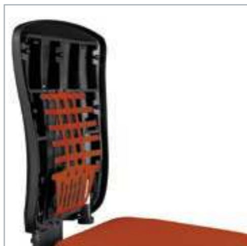
Höhen- und tiefeinstellbare KÖHL- Bandscheiben-Stütze (KBS®). Hoogte- en diepte instelbare KÖHL-Lendensteun (KBS®).