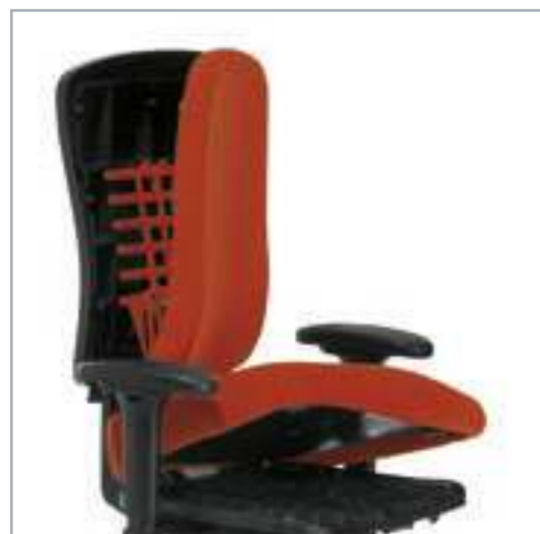
KÖHL- Polster-Clip-System für Sitz- und Rücken ermöglicht den werkzeugfreien Wechsel der Polstergarnitur. Polster-Clip-Systeem voor zitting en rug, gereedschapvrij verwijderen van de stoffering.