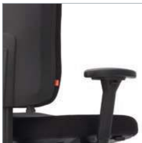
3D-Armlehne Nr. 10 Komfortable PU-Auflage, 10 cm höhenestellbar, 5,5 cm tiefeinstellbares Pad, schwenkbar je Seite 30°. Zusätzlich 8 cm breitenestellbar mit Schnellverschluss. Mit Ergo Pad. 3D-armleuningen No. 10 Comfortabele PU-ampad. Tot 10 cm in hoogte instelbaar. Zwenkbaar tot 30° en in de breedte in te stellen tot 8 cm via de snelkoppeling. Als extra kan de ampad tot 5,5 cm in de diepte worden ingesteld.